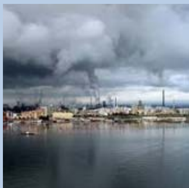
L'ambiente in cui viviamo