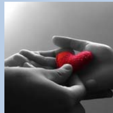
Le emozioni che proviamo