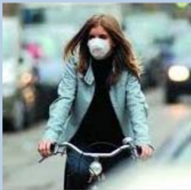
L'aria che respiriamo