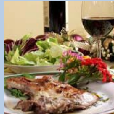
Il cibo che mangiamo