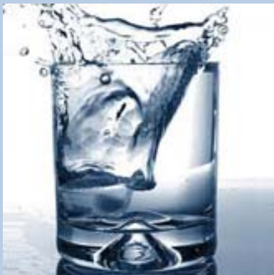
L'acqua che beviamo