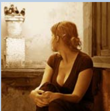
I pensieri che facciamo